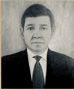
General (r) Gustavo Matamoros Camacho Nov 21/2011 - Oct 07/2014