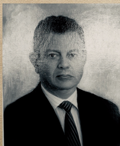
Coronel (r) Carlos E. Villareal Quintero Ene 26/2003 - Abr 01/2011