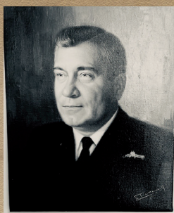
Almirante (r) Manuel F. Arendano Galvis Nov 1/90 - Oct 31/91