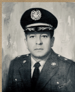
Mayor General Alberto Camacho Leyva Sep 17/74 - Sep 25/78