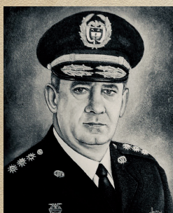
General (r) Nelson Mejia Henao Abr 17/95 - Abr 2/01