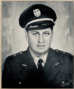
Brigadier General Ernesto Beltran Rocha Dic 30/66 - Oct 5/69