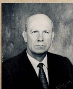
Almirante (r) Tito García Motta Oct 1/86 - Oct 31/90