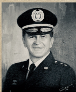
Mayor General Hernán Hurtado Vallejo Abril 1/83 - Sep 31/86