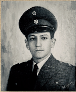
Mayor General Alfonso Ahumada Ruiz Dic 24/55 - Ene 27/61