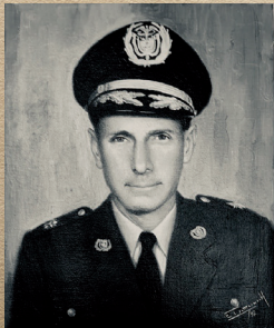
Brigadier General Alejo Sanchez O'donogue Oct 16/69 - Sep 16/74